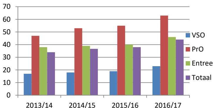
Grafiek 1. Weergave van het aandeel jongvolwassenen dat werkt in loondienst in procenten.